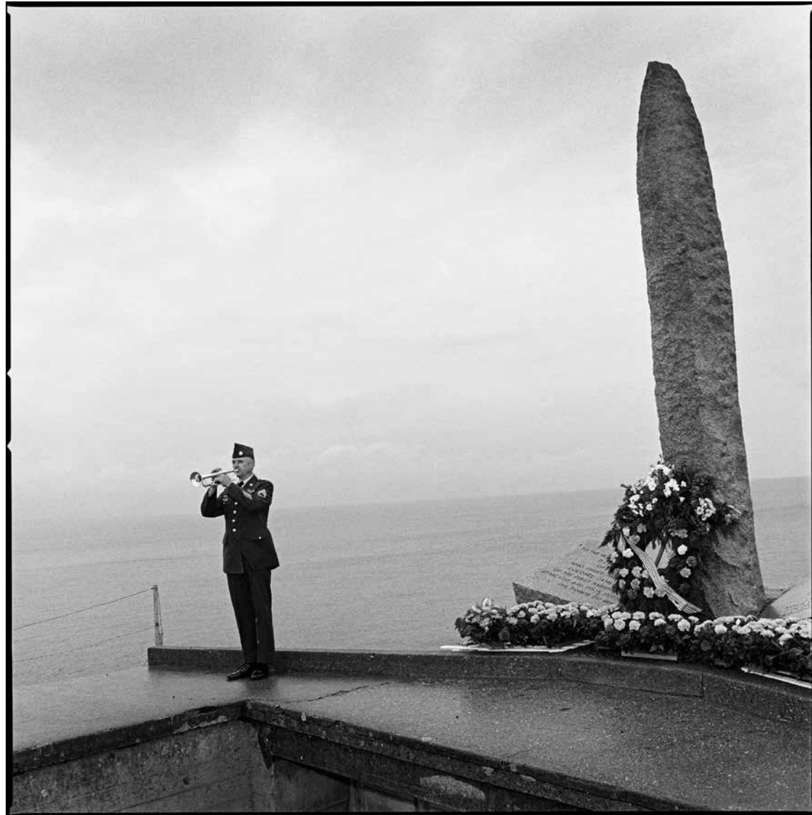
Sonnerie aux morts jouée à la Pointe du Hoc, 1990