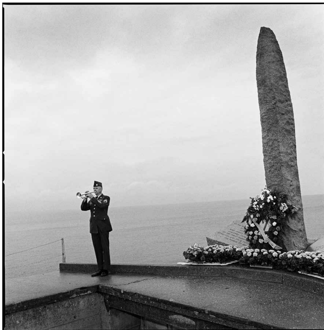
Sonnerie aux morts jouée à la Pointe du Hoc, 1990